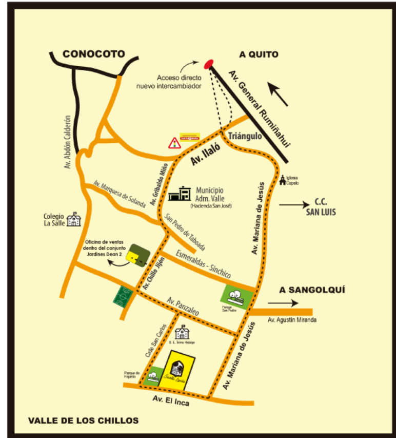
Plano de Ubicación: